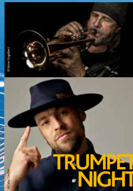
Sa. | Sa., 3.10.2026, 19:30 h Festhalle Pirmasens