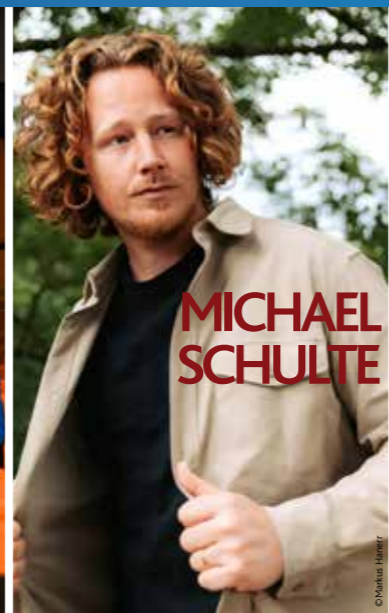
Do. | Je., 24.9.2026, 19:30 h Festhalle Zweibrücken