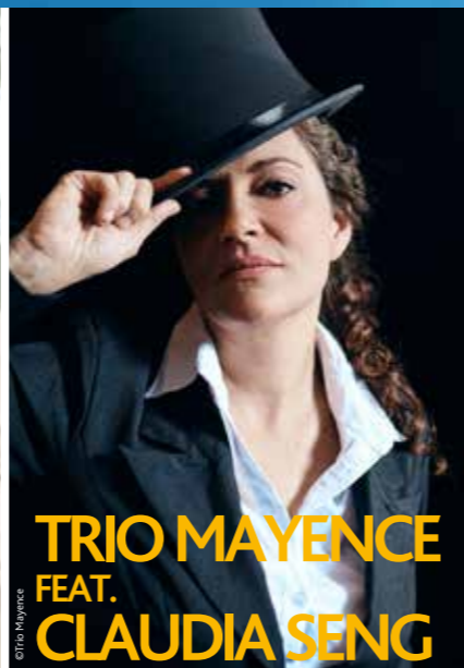
Fr. | Ve., 2.10.2026, 19 h DGH Dellfeld