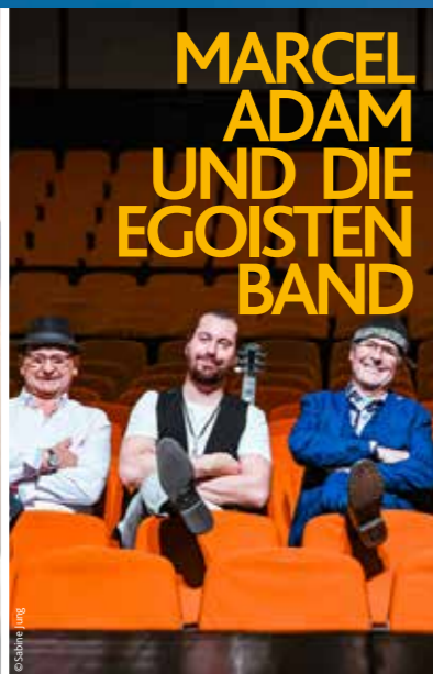
Fr. | Ve., 18.9.2026, 20 h Bliesgau-Festhalle