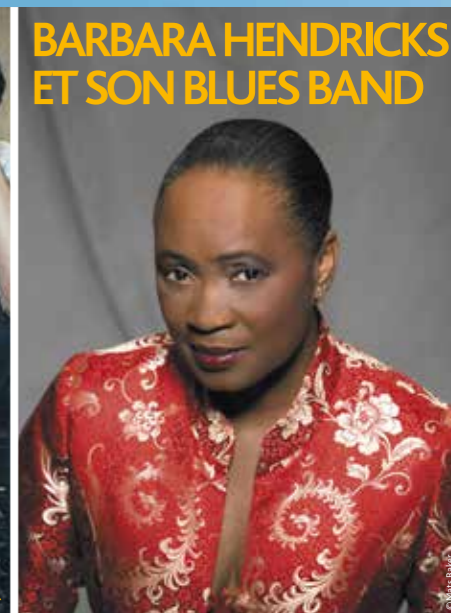
Fr. | Ve., 16.10.2026, 20 h Espace René Cassin, Bitche