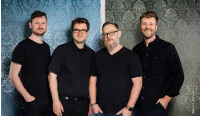
Pitch Pipe Project