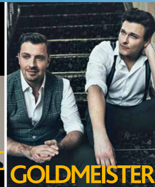
Sa. | Sa., 10.10.2026, 19:30 h Festhalle Zweibrücken