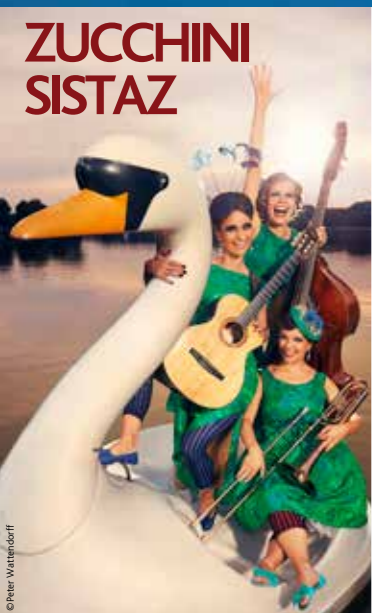
Fr. | Ve., 11.9.2026, 19:30 h Festhalle Pirmasens